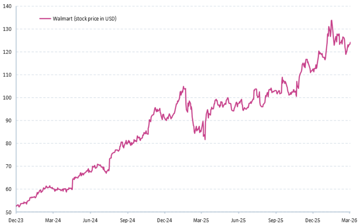
Abbildung 3 | Aktien von Walmart haben sich erholt, da das Unternehmen Marktanteile bei einkommensstarken Verbrauchern gewonnen hat

Obwohl Unternehmen wie Walmart (+12 %) mit seiner EDLP-Strategie (Every-Day-Low-Prices) profitieren, hatten die meisten konsumorientierten Aktien zu kämpfen. In den USA gaben das Kosmetikunternehmen Ulta Beauty (-14 %) und das Bauunternehmen NVR (-10 %) stark nach, während in Europa Luxusgüterhersteller wie Richemont (-19 %) und Hermes (-24 %) wie auch andere unter der mangelnden Kaufkraft der chinesischen Verbraucher zu leiden hatten.