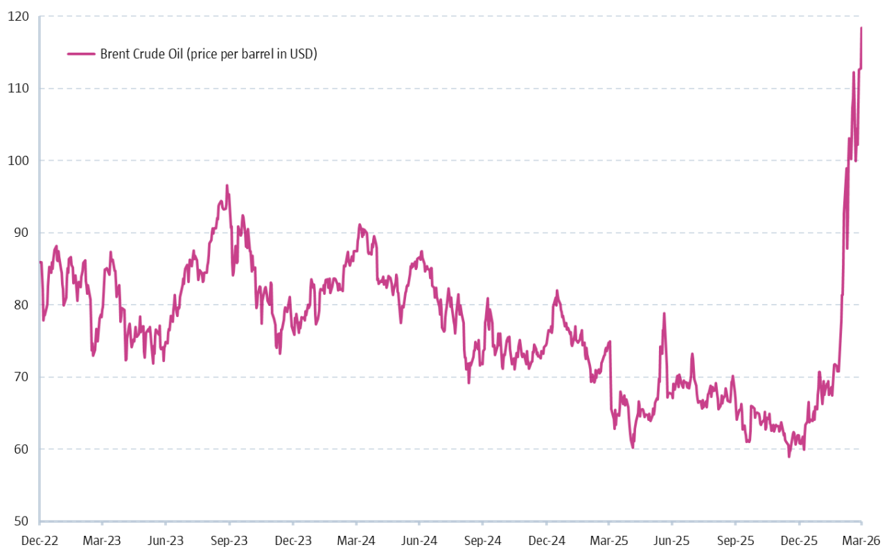
Abbildung 1 | Ölpreise sind auf ein Mehrjahreshoch gestiegen

Infolge des Konflikts und der iranischen Blockade der Straße von Hormus verzeichneten die Ölpreise ihren größten monatlichen Anstieg aller Zeiten. Der Preis für ein Barrel Rohöl der Sorte Brent erreichte am Ende des ersten Quartals bis zu 119 USD pro Barrel, was einem Anstieg von 63 % seit Beginn des Konflikts entspricht. Der Ölhandel ist seither extrem volatil, der Preis stieg aufgrund der Aussagen von Präsident Trump und fiel anschließend wegen der Hoffnung auf ein Friedensabkommen. Zum Zeitpunkt der Erstellung dieses Berichts ist eine Einigung noch lange nicht sicher, da die USA signalisiert haben, bereit zu sein, ihre Militäraktion in den kommenden Wochen auszuweiten. Je länger der bewaffnete Konflikt andauert, desto wahrscheinlicher ist es, dass die Ölpreise hoch bleiben und das weltweite Wirtschaftswachstum leidet. Höhere Energiekosten wirken wie eine Steuer auf die Weltwirtschaft, da sie im Allgemeinen zu einem Anstieg der Preise für Waren und Dienstleistungen führen. Daher haben Haushalte, die mehr für Brennstoff und Heizung ausgeben müssen, tendenziell weniger verfügbares Einkommen für andere Güter, wodurch ihr Konsum gebremst wird. Und schließlich können steigende Transport- und Logistikkosten die Lieferketten erheblich stören und sich weltweit negativ auf Unternehmen auswirken.